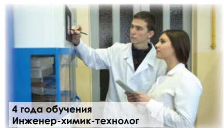
4 года обучения Инженер-химик-технолог

Химическая технология переработки древесины