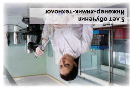
Технология лекарственных препаратов