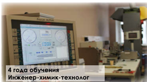
4 года обучения Инженер-химик-технолог

Химическая технология органических веществ, материалов и изделий