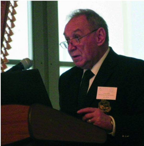
ОДНА КАФЕДРА, ТРИ ГОДА И ТРИ ИТОГА 3 ЯНВ, 2015