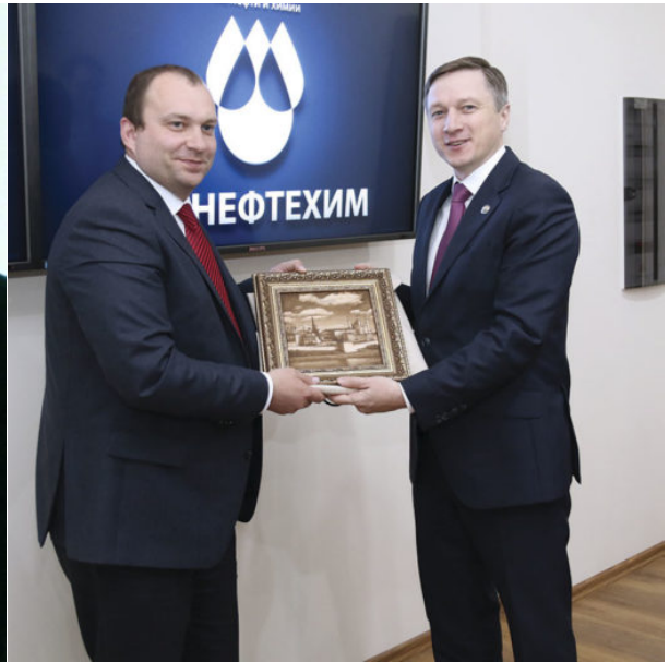
БЕЛАРУСЬ И ТАТАРСТАН НАРАЦИВАЮТ ТОВАРООБОРОТ