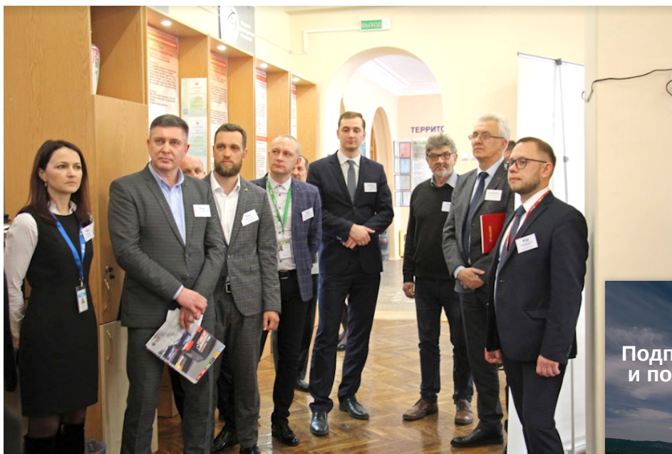
На фото: представители Группы компаний 1AK-GROUP, ГКНТ,МАЗ, НАН Беларуси.

В течение 9 месяцев участники вместе с научными руководителями и экспертами займутся разработкой новых технологических решений в заданных направлениях. Результатом проделанной работы станет помощь от компаний-партнеров в реализации проектов, занявших призовые места.