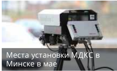
Места установки МДКС в Минске в мае