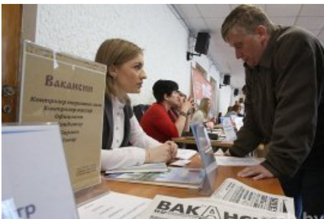
На этой неделе в Минске пройдут 3 мини-ярмарки вакансий и 2 дня предприятия