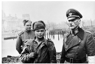
Немец рассказал правду о