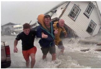
Жители Нью-Йорка в