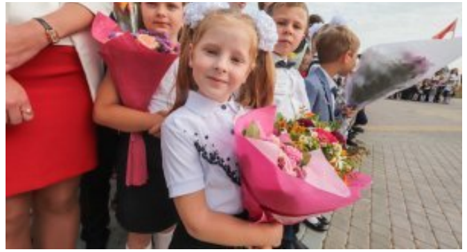
В День знаний торжественно открыта боровлянская СШ №3 в Минском районе