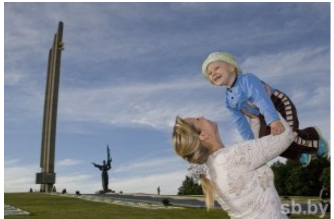
Какие объекты откроются ко Дню города