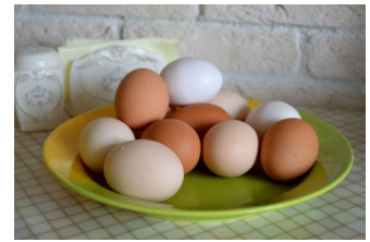
Вкрутую или всмятку: врач