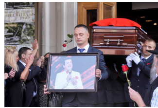
ЧП у гроба Кобзона: Охрана