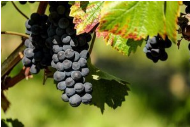
Лето не сдастся: в Беларуси во вторник до 30 тепла