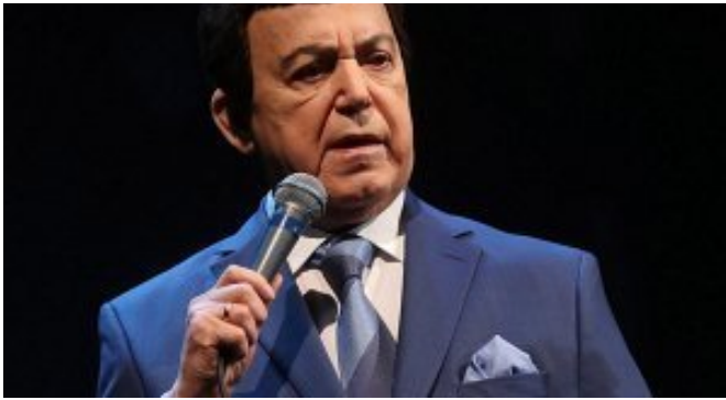
Десятки человек выстроились в очередь, чтобы проститься с Иосифом Кобзоном