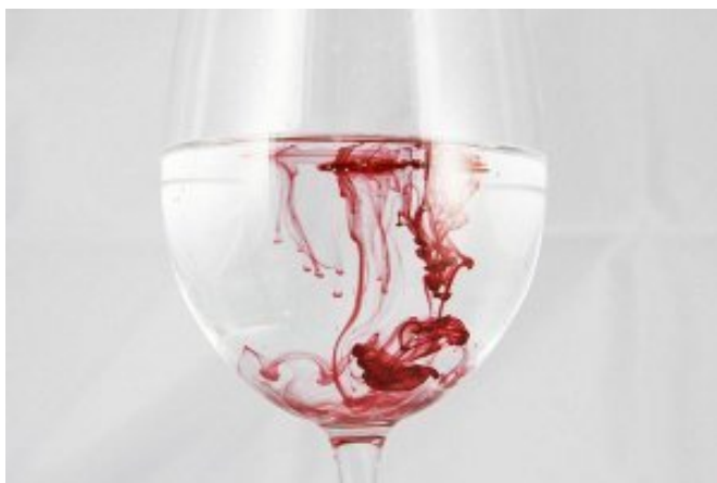
Муж обезглавил жену на глазах у 3-летней дочери за то, что отказалась покаяться